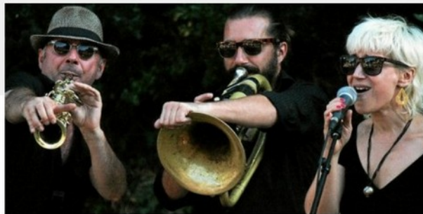
Les musiciens de cette fanfare ont une excellente présence scénique.

CHEZ VOUS Accédez à toute l'actualité de votre commune