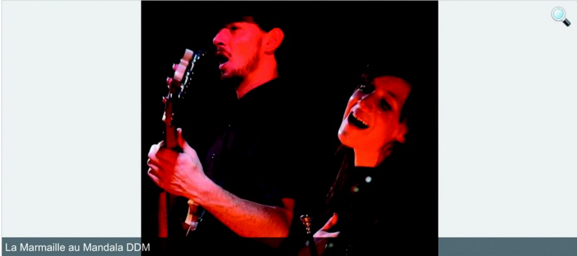
La Marmaille au Mandala DDM

Formation aux accents cuivrés, propulsée par une section basse-batterie énergique et électrisée, la Marmaille est une fanfare atypique qui se propose de revisiter des petites perles piochées dans des genres aussi divers que le jazz actuel, le ska, le surf, la musique des balkans et le rock progressif notamment.